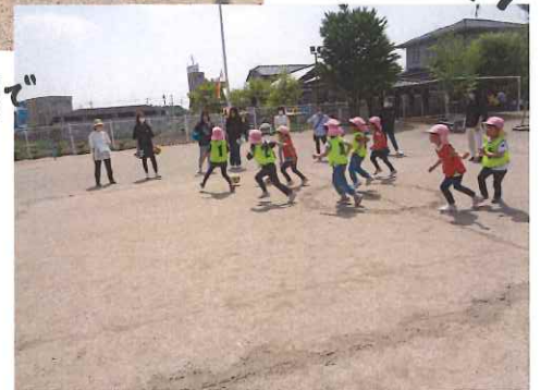
ママたちの応援団で 頑張ります！ ♡がんばれー♡