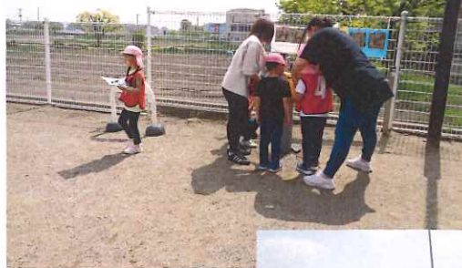
サッカーグループ