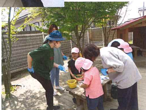
保護者の方と 楽しんで嬉しく♡ ママの手でにぎると 大きいお団子が できた☆