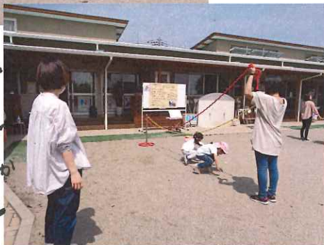
2本使って いろはにほけと 上か下か真ん中か