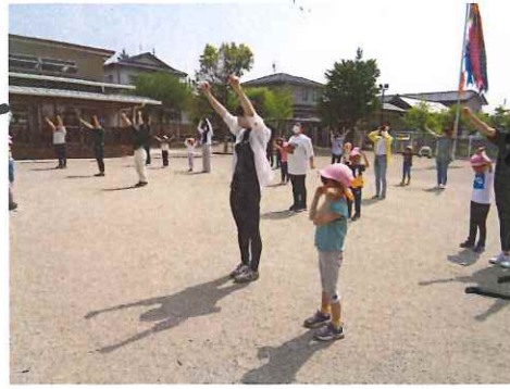
R5. 4. 21(金) ぽら組