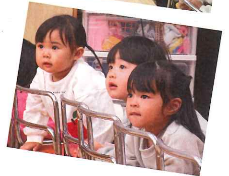
先生たちも ペッピン! がんばって～!