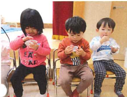
おいしい～ あま～いっ